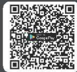
ดาวน์โหลด Application IR PLUS AGM สำหรับ Android Ver. 9 ขึ้นไป