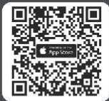
ดาวน์โหลด Application IR PLUS AGM สำหรับ iOS 15 ขึ้นไป

ในวันประชุม ผู้ถือหุ้น/ผู้รับมอบฉันทะ Log in เข้าสู่ระบบ IR PLUS AGM กรอกรหัส Pincode 6 หลัก เพื่อลงคะแนนเข้าร่วมประชุม