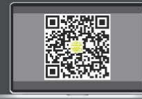
การใช้งานบน Web App "webagm.irplus.in.th"