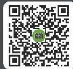
คู่มือการใช้งาน ระบบ IR PLUS AGM TH และ ENG